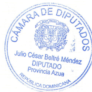
JULIO CESAR BELTRE MENDEZ Diputado del Congreso Nacional. Provincia Azua.