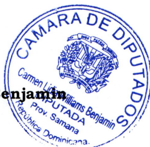
Carmen Lidia Williams Benjamin Diputada de la República Provincia Samaná

Santo Domingo, Distrito Nacional 30 de abril del 2026.