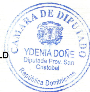
Licda. Ydenia Doñe Tiburcio Diputada Provincia San Cristóbal Partido de la Liberación Dominicana, PLD

Único. Recomendar al presidente ejecutivo del Banco de Reservas de la República Dominicana, la instalación de una sucursal de dicha entidad en el Distrito Municipal de Hatillo, provincia San Cristóbal.