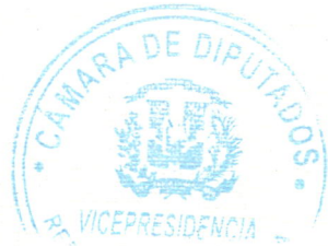
Dharuelly D'Aza Caraballo. Vicepresidenta de la Cámara de Diputados. Diputada de la provincia Santiago. DD/pe