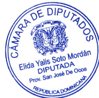
Licda. Elida Yalis Soto Mordan Diputada al Congreso Nacional